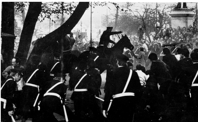
Bild 3. I stridens hetta. Ockupationen av almarna i Kungsträdgården nådde ett våldsamt klimax natten till den 12 maj 1971 när poliser med hjälp av hästar och hundar försökte bana väg för fällning av träden. Foto: Sven-Erik Sjögren, publicerad i DN i beskuret skick 13 maj 1971. Copyright: TT. Licens: CC BY-NC-ND

När arkitekten Torbjörn Olsson skrev om tävlingen 1952 såg han för sig hur Kungsträdgården skulle kunna bli "en brännpunkt för livet" på Nedre Norrmalm. 21 Parken användes då för möten och demonstrationer, men föga anade han hur det tjugo år senare skulle hetta till ordentligt. Norrmalmsregleringen och planerna för en tunnelbanestation med en butik i Kungsträdgården utvecklades i maj 1971 till den så kallade Almstriden, en ockupation under ledning av Alternativ stad som under några intensiva dagar fick en mycket varierad och stor skara människor att strömma till parken för att protestera mot dessa planer (Bild 3). 22