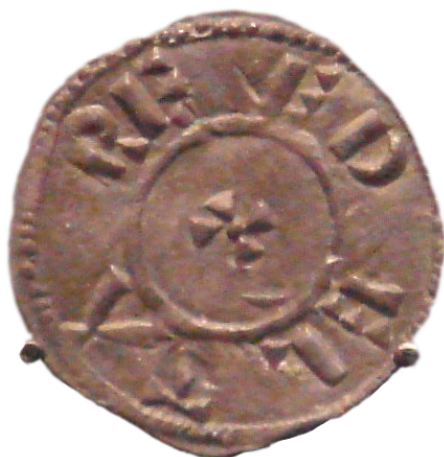
Figur 3. Mynt präglat med Æthelstan II:s namn och signum. Efter: https://en.wikipedia.org/wiki/Guthrum#/media/File:Aethelstan_II_Guthrum_Viking_king_of_East_Anglia_880.png (Public Domain; tillgänglig 3.12.2012).

döpa sig. Alfred fick stå som fadder för Guthrum under ceremonin. Riten gav intryck av att Guthrum formellt underkastat sig Alfred, och den kan förstås mot bakgrund av idén att en kristen härskare inte kan ha en medtävlare, utan skall luta sig mot sin egen auctoritas , 'auktoritet'. Guthrums underkastelse underströks också av att han tog sig namnet Æthelstan II, ett namn som hörde till Alfreds släkt; Æthelstan I var Alfreds bror (fig. 3). I gengäld gav Alfred Guthrum och hans män generösa gåvor. Enligt Asser (kap. 56) bestod de bland annat av "många fina hus", vilket väl får förstås som gods.